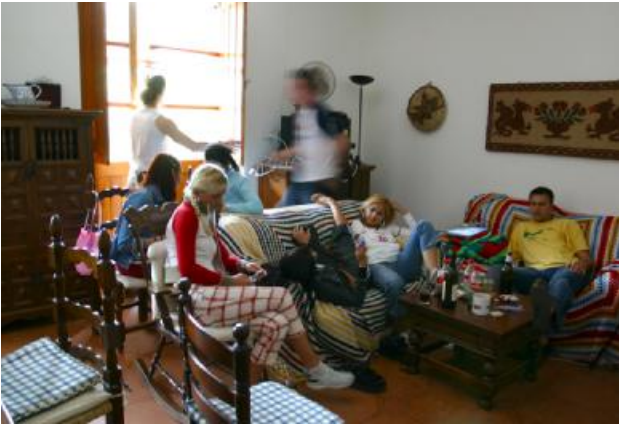
Das Warten nervt! Da tröstet uns nur das Kaminfeuer...