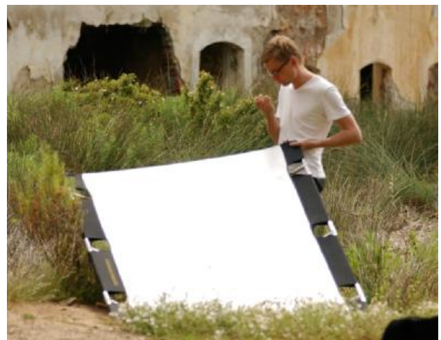
Der Assistentenjob ist zuweilen etwas langweilig.