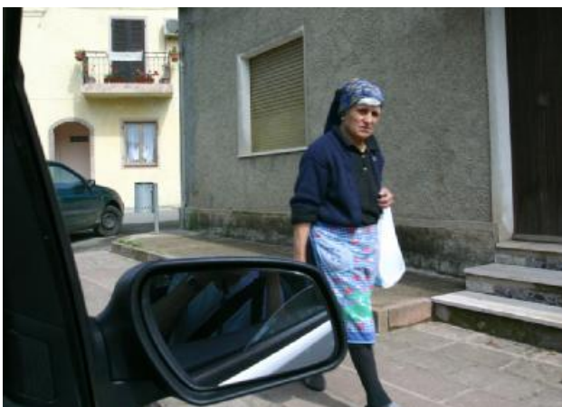
Die örtliche Bevölkerung ahnt nichts von unserem Vorhaben.

12.00 Uhr: Genau das habe ich befürchtet: Eine Großfamilie kreuzt mit zwei Autos auf und schlägt ihr Lager direkt an unserem Arbeitsort auf. Heute