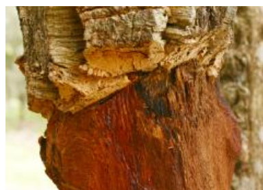
Das braune Gold Sardinens: Überall in den Bergen wird Kork gewonnen.