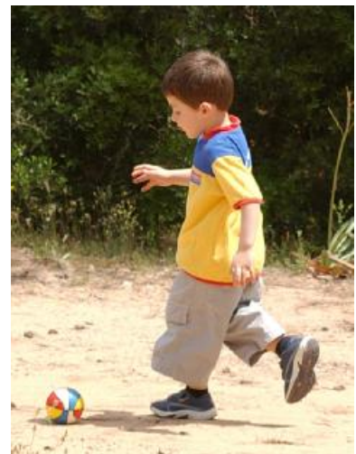
Leider nicht für lange: Der Ort wird für andere Zwecke gebraucht.