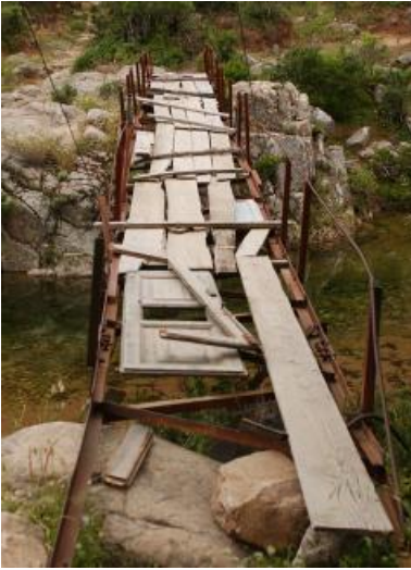
Die Wege zu unseren Locations sind nicht immer vertrauenswürdig.