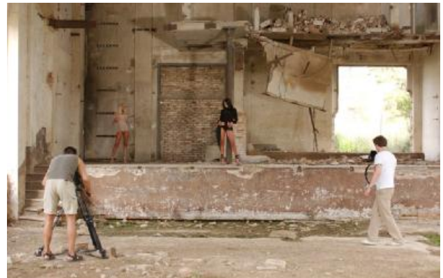
...dann kann die Show beginnen!