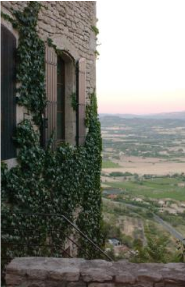
Hoch über dem Tal von Apt: die Festungsstadt Gordes.