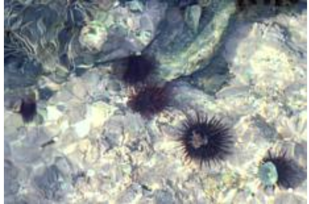
Der Schrecken der Cote Vermeille: Seeigel!

im Licht der aufsteigenden Sonne. Super! Nur die Seeigel machen uns das Leben schwer. Es sind so viele, dass man sich nur mit großer Vorsicht bewegen kann.