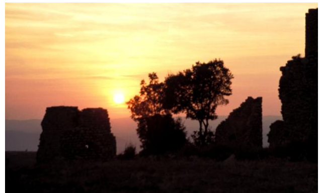
Das alte Gemäuer verabschiedet sich prunkvoll.

21.15 Uhr: Endlich Schluss für heute. Bis zum Hotel müssen wir noch eine ganze Stunde fahren. Eigentlich wollten wir noch eine Kleinigkeit essen, aber jetzt haben alle keine Lust mehr dazu und wollen nur noch ins Bett. Ich habe ein schlechtes Gewissen, weil ich meine Leute so quäle. Immerhin ist das Hotel sehr schön, in einer kleinen Stadt direkt am Marktplatz gelegen.