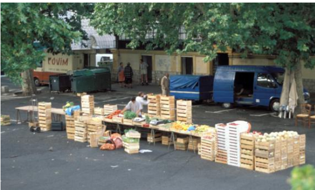
Früher Morgen in einer kleinen französischen Stadt: Die Marktleute sind schon bei der Arbeit.