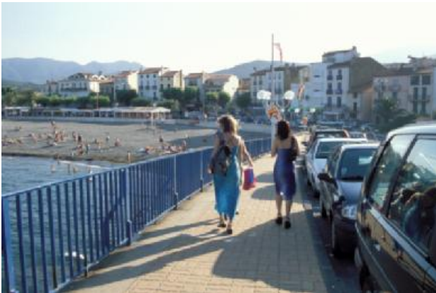
Endlich im Süden: Erstmal geht's zum Strand!

14.30 Uhr: Ein Autobahnparkplatz in der Nähe von Nimes. Nirgends gibt es so schöne Autobahnparkplätze wie in Frankreich, und dieser ist besonders nett: Heller Kalkstein und schattenspendende Pinien lassen südländische Stimmung aufkommen, auch an Zikaden fehlt es nicht. „La Languedocienne“ heißt die Strecke - sogar die Autobahnen haben in diesem Land charmante Namen!