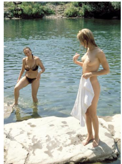
Ende: Im Wasser ist es noch besser!

19.00 Uhr: Eine gute Zeit, um in Frankreich ins Restaurant zu gehen. Wir sind die ersten Gäste, können uns den Tisch aussuchen und werden super bedient. Wir sitzen unter Platanen und verputzen ein Drei Gänge-Menü inklusive Wein - ein schöner Abschluss!