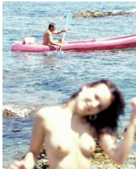
Ein mariner Passant.