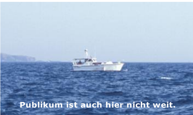
Publikum ist auch hier nicht weit.