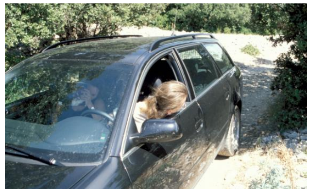
Rück-Fahrt: Breit ist das Auto, schmal ist der Weg.