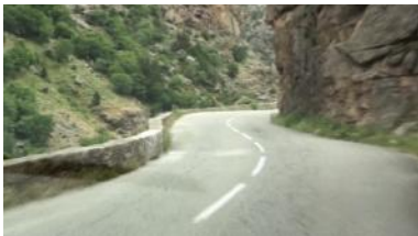
Die "Treppe der heiligen Königin" führt uns zu unserem Nachtquartier.

18.30 Uhr: Zunächst geht es zurück auf die Hauptstraße, die die Insel überquert, später dann auf einer schmalen, kurvigen Straße, die den spek-