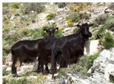
Dort entsteht eine bukolische Szenerie mit Ziegen und nackten Mädchen.

gungen sind perfekt: Es ist sonnig und warm, die Mädels mögen den Ort und haben gute Laune. Ein bisschen Sonne auf der Haut ist immer willkommen, bald sind die Kleider abgelegt. Eine geradezu bukolische Szene entsteht: Ein Bach, eine alte Brücke, ein paar nackte Mädels und ringsherum verstreut eine Herde Ziegen.