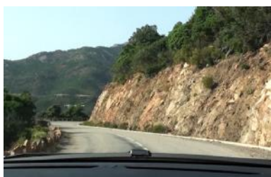
Eine Straße mit endlosen Kurven führt uns zur Küste hinunter.

16.30 Uhr: Als wir endlich gegessen haben und weiterfahren können, ist es schon später Nachmittag. Nicht gut, denn ich möchte heute schon gerne noch an einer zweiten Location arbeiten, und der Weg dorthin ist weit! Eine enge Straße führt uns mit zahllosen Kurven über das Gebirge hinweg Richtung Meer. Eine wunderschöne Strecke, aber heute bekommen wir so etwas wie eine Überdosis: Die Fahrt zieht sich über Stunden, die Kurven scheinen niemals zu enden.