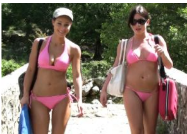
Nach einem kurzen Weg erreichen wir unser Ziel.

11.00 Uhr: Es ist schon später Vormittag, als wir endlich das Hotel verlassen. Zu unserer Location ist es immerhin nur eine kurze Fahrt von ein paar Kilometern. Vom Parkplatz aus haben wir dann noch einen Weg von einer knappen halben Stunde zu laufen. Der Pfad führt uns über altes Kulturland mit steinigen Weiden und einigen wenigen uralten Bäumen. Zwischendurch treffen wir eine Herde Ziegen, die uns neugierig anstarren.