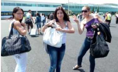
Wir erreichen Korsika schon am frühen Nachmittag.

11.00 Uhr: Am heutigen Vormittag setzen wir unsere Reise mit einem Flug von Paris nach Bastia, der größten Stadt Korsikas, fort. Wir sollten dort so zeitig ankommen, dass wir heute Nachmittag noch ein erstes Shooting schaffen können. Mit einer kurzen Zugfahrt zum Flughafen verlassen wir Paris.