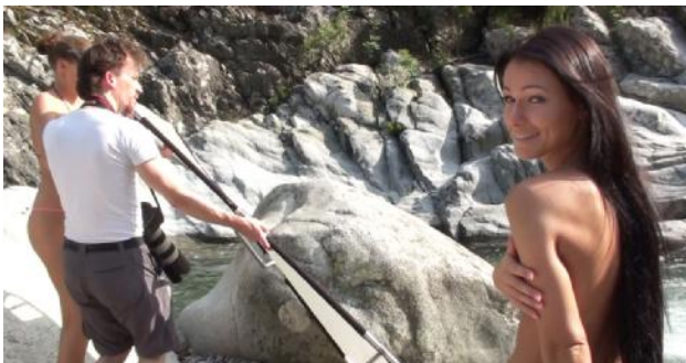
Also ist noch reichlich Zeit für ein erstes Shooting!

17.00 Uhr: Es dauert noch eine Weile, bis wir endlich beginnen können. Aber das erste Shooting