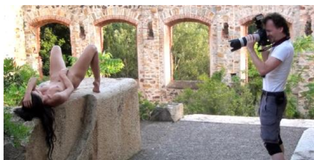
Für das letzte Shooting bleibt nicht viel Zeit. Schon bald müssen wir wieder zusammenpacken.

21.30 Uhr: Zum Glück ist es zum Hotel für heute nacht jetzt nicht mehr weit, kurz nach neun treffen wir dort ein. Wir befinden uns jetzt in Calvi, einer ausgesprochen hübschen Kleinstadt an der Westküste Korsikas. Calvi ist eines der touristischen Zentren der Insel, aber alles spielt sich hier auf einem angenehm hohen Niveau ab. Ein kleiner historischer Stadtkern gruppiert sich um eine spektakuläre Festung, der Jachthafen wird gerne von außergewöhnlich vermögenden Touristen benutzt.