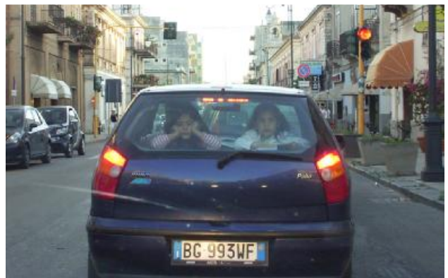
Namenlose Dörfer ohne Anfang und Ende machen uns das Leben schwer.

20.15 Uhr: Der charmante Kellner ist entzückt, unsere Mädels kennenzulernen, und fängt sofort das Flirten an. Leider nicht ganz einfach für ihn, weil er ausschließlich Italienisch spricht. Pech! Das Essen, das er serviert, ist dafür deutlich besser als gestern.