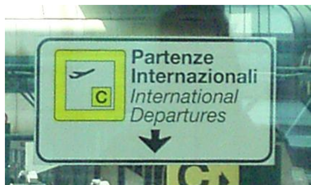
Heute funktioniert alles: Genau zur geplanten Zeit erreichen wir den Flughafen.

12.00 Uhr: Aber heute läuft tatsächlich alles nach Plan! Exakt zur geplanten Zeit treffen wir am Flughafen in Rom ein. Unsere beiden Fahrzeuge haben über 2000 km mehr auf dem Tacho als vor fünf Tagen! Genug Zeit, um die Autos auszuräumen und uns in Ruhe voneinander zu verabschieden, bevor wir die verschiedenen Check-In-Schalter auf dem weitläufigen Flughafen suchen.