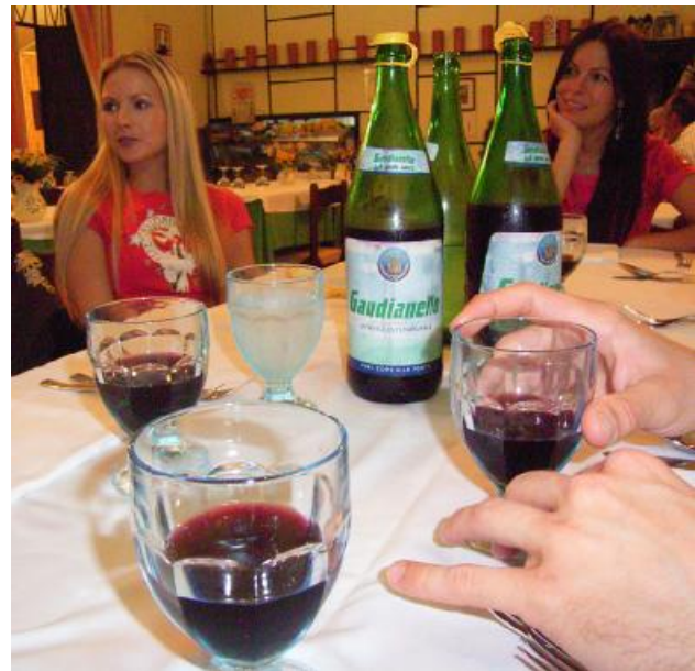
Der Besuch in der familiären Trattoria wird zu einem gelungenen Abschluss der Reise.

20.45 Uhr: Wir stellen fest, dass die Lady recht hatte: Das abgewetzte Interieur strahlt einen kauzigen Charme aus. Die Auswahl an Speisen ist begrenzt, aber alles wird liebevoll und mit großer Sorgfalt zubereitet. Während der Padrone in der Küche für uns Pasta kocht und Fleisch brät, serviert uns seine Frau selbst gekelterten Rotwein, zwanglos in Mineralwasserflaschen abgefüllt. Auch die Rechnung erstaunt: Wir hatten auf dieser Reise schon einmal fast das Doppelte für ein wesentlich schlechteres Essen bezahlt!