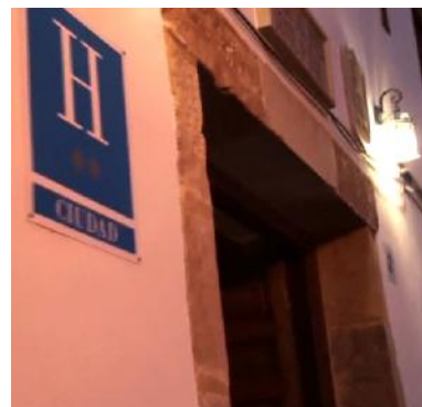
Wieder ist es spät, als wir unser Quartier erreichen.

21.30 Uhr: Es ist kurz vor Einbruch der Dunkelheit, als wir unser Hotel erreichen. Es ist ein hübsches Haus im Zentrum eines ziemlich langweiligen Dorfes in einer nicht besonders spannenden Gegend. Sicherlich kommen nur selten Fremde hierher – kein Wunder, dass uns die in der Nähe versammelte Dorfjugend neugierig anstarrt!